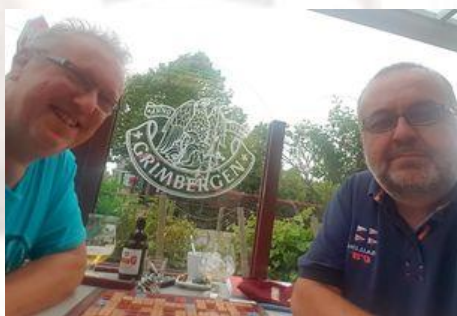
Les deux compères