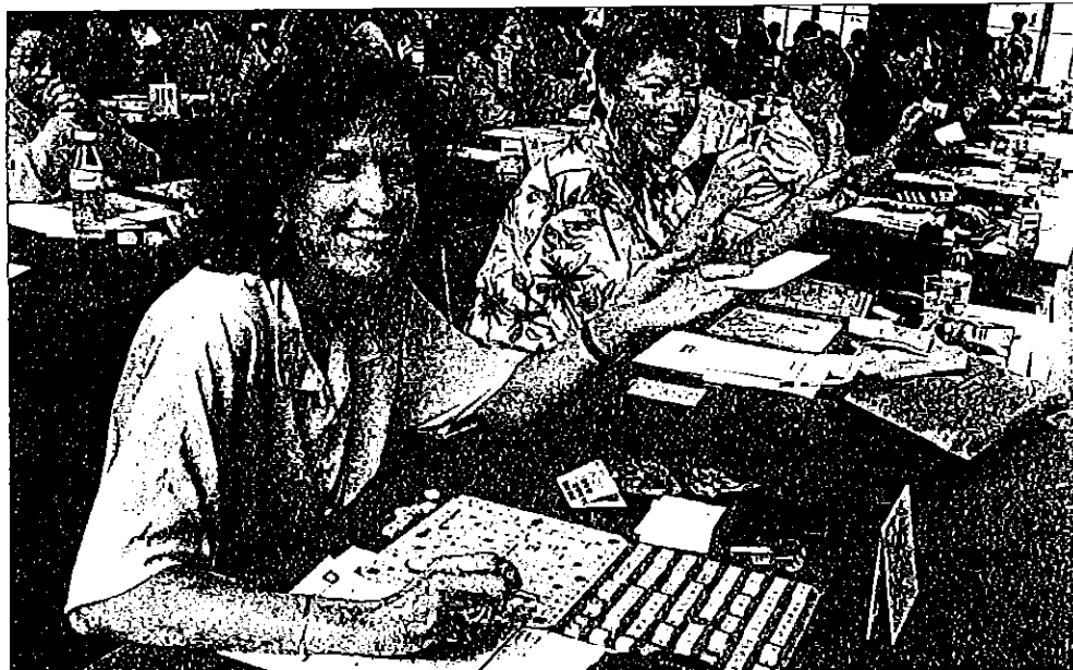
Concentration et rapidité pour trouver la meilleure combinaison.